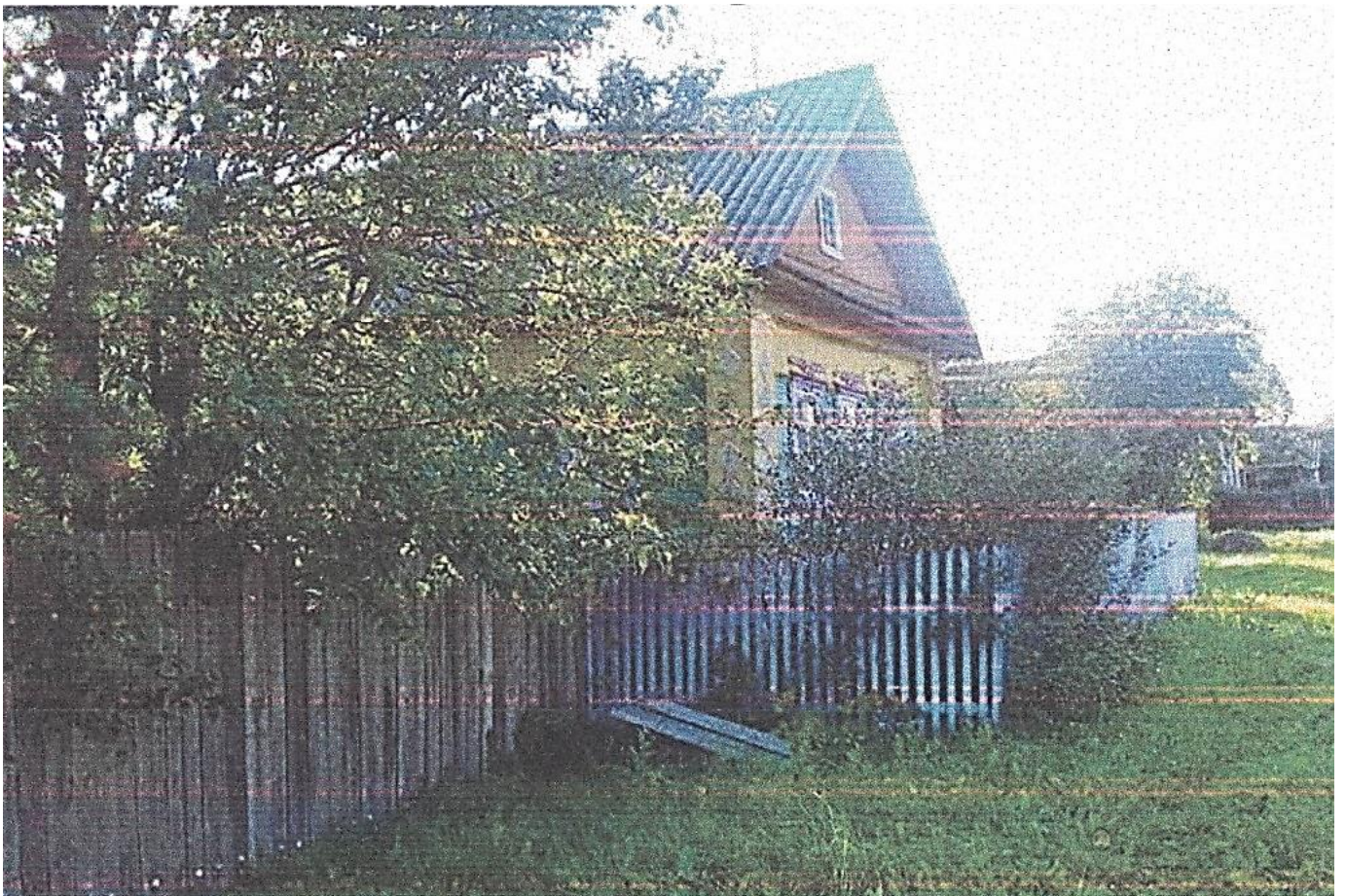
На фото родительский дом, в котором прошло его детство.

Он самый младший и – единственный неслышащий из-за родовой травмы.